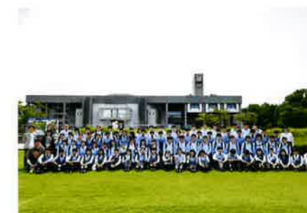
名古屋大学見学会