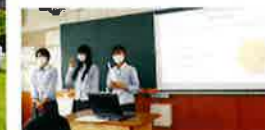
主権者教育「政策提言」