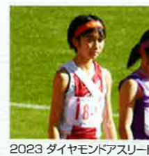
2023 ダイヤモンドアスリート

第19回U20カリ世界陸上選手権大会(コロンビア) 女子1500m 6位入賞 令和4年度全国高等学校総合体育大会 男子110mH 準決勝進出 女子400m 準決勝進出 女子100mH 準決勝進出 女子4×100mリレー 準決勝進出 女子4×400mリレー 準決勝進出 第77回国民体育大会 少年女子A3000m 2位 成年少年女子共通4×100mリレー(※) 5位 成年少年男女混合4×400mリレー(※) 出場 少年女子B100mH 優勝 第18回U18陸上競技大会 男子300mH B決勝5位 女子100mH B決勝1位 女子300m B決勝3位 第41回全国都道府県対抗女子駅伝競走大会2区 19位(区間4位) 第106回日本陸上競技選手権大会 室内競技2023日本室内陸上競技大阪大会 U20 60mH 出場 U20 60mH B決勝3位 U20 60mH 出場 U18 60mH 出場 U18 60mH B決勝4位 パースト2023世界クロスカントリー選手権(オーストラリア) U20 5000m 出場